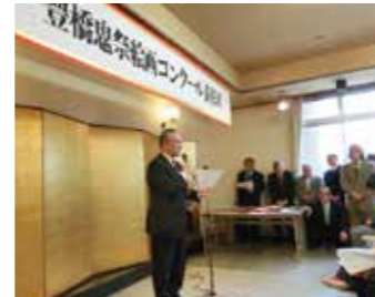
豊橋鬼祭絵画コンクール 表彰式