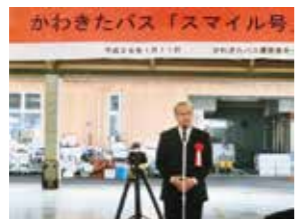
かわきたバス スマイル号 出発式