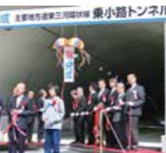
乗小路トンネル 完成記念式典