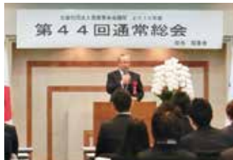
豊橋青年会議所通常総会