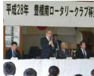
豊橋南ロータリークラブ杯 第37回豊橋少年柔道大会