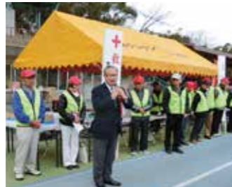
豊橋グラウンドゴルフ協会 新春初打ち大会